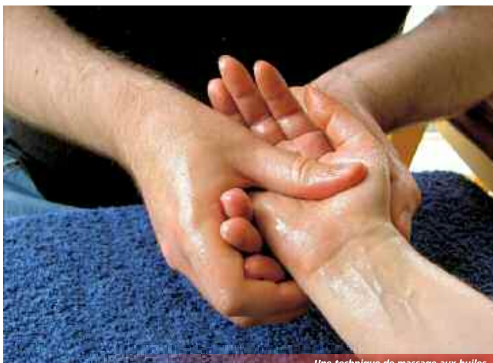
Une technique de massage aux huiles

Informations 30 euros de l'heure. Séance à domicile sur Grenoble et agglomération. 06 50 36 35 08 / www.pinceauxdouceur.com