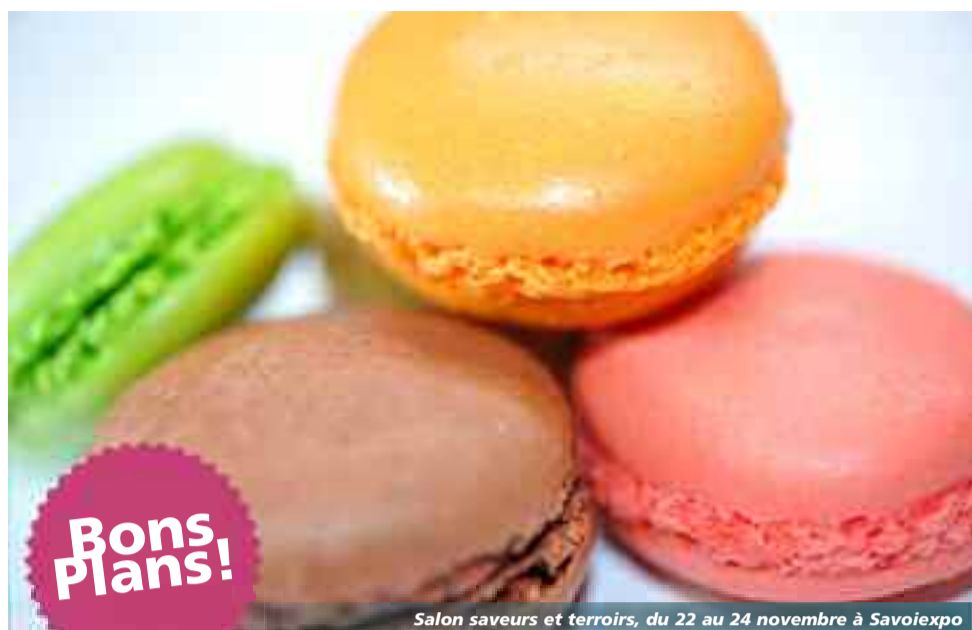
Salon saveurs et terroirs, du 22 au 24 novembre à Savoieexpo