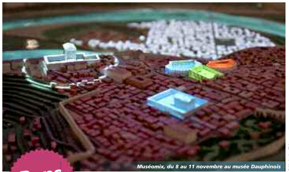
Muséomix, du 8 au 11 novembre au musée Dauphinois

Week-end du 7 et 8 décembre de 10 h à 19 h - Place de la République