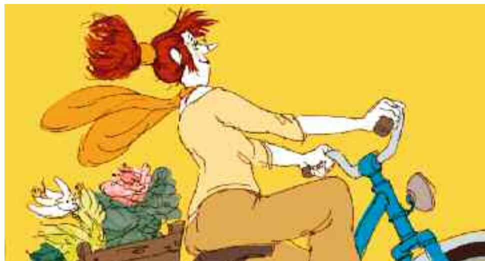
© Tante Hilda de Jacques-Rémy Girerd